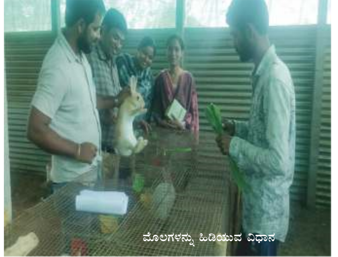
ಮೊಲಗಳನ್ನು ಹಿಡಿಯುವ ವಿಧಾನ

ನಿರ್ವಹಣೆ: ಮೊಲಗಳಿಗೆ ನೆಗಡಿ, ಜ್ವರ, ಬೇಧಿ, ಕಜ್ಜಿ ಹಾಗೂ ಇನ್ನಿತರೆ ಚರ್ಮ ರೋಗಗಳು ಸಾಮಾನ್ಯ. ಆದರೆ ಸಕಾಲಕ್ಕೆ ಅದನ್ನು ಗುರುತಿಸಿ ಸರಿಯಾದ ಚಿಕಿತ್ಸೆ ನೀಡದಿದ್ದರೆ ಸಾವು ನಿಶ್ಚಿತ ಎನ್ನುತ್ತಾರೆ. ರೋಗಗಳನ್ನು ಹತೋಟಿ ಮಾಡಲು ಮೊಲಗಳ ಕೊಠಡಿಯು ಸ್ವಚ್ಛತೆ, ಗಾಳಿ-ಬೆಳಕು ಹೇರಳವಾಗಿರುವಂತೆ ಕಾಳಜಿವಹಿಸುವುದು ಹಾಗೂ ತಿಂಗಳಿಗೊಮ್ಮೆ ಕೊಠಡಿಗೆ ಬ್ಲೀಚಿಂಗ್ ಪೌಡರ್ ಹಾಗೂ ಸುಣ್ಣ ಹಾಕುತ್ತೇವೆ ಎನ್ನುತ್ತಾರೆ. ಇದರ ಜೊತೆಯಲ್ಲಿ ಕೇಜ್‌ನಿಂದ ಕೆಳಬೀಳುವ ಹಿಕ್ಕೆ, ಮೂತ್ರವನ್ನು ಎರಡು ದಿನಕ್ಕೊಮ್ಮೆ ಗುಡಿಸಿ ಗೊಬ್ಬರ ಸಂಗ್ರಹಿಸುವುದು, ಸ್ವಚ್ಛ ಮಾಡುವುದು ಅಗತ್ಯ ಎನ್ನುತ್ತಾರೆ. ಈ ಹಿಕ್ಕೆ, ಮೂತ್ರದಲ್ಲಿ ಬೆಳೆಗೆ ಬೇಕಾಗುವ ಪೋಷಕಾಂಶ