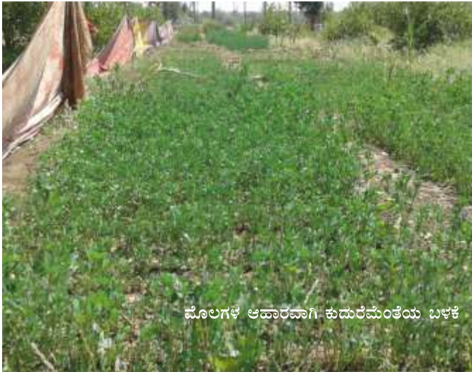
ಮೊಲಗಳ ಆಹಾರವಾಗಿ ಕುದುರೆಮೆಂತೆಯ ಬಳಕೆ