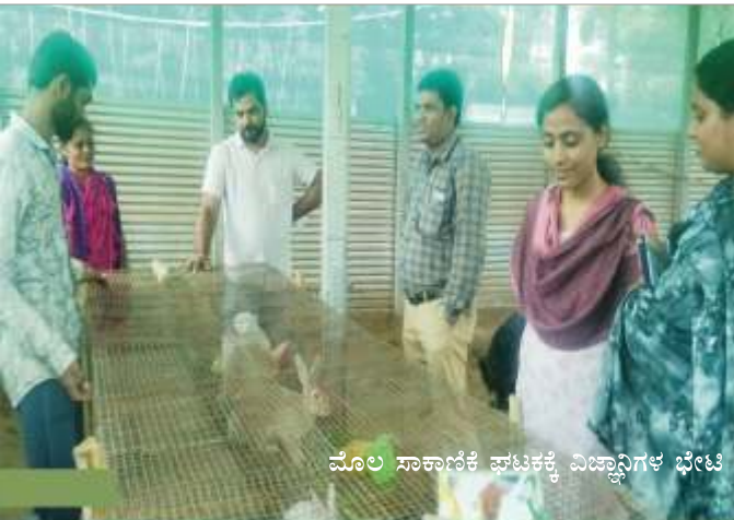
ಮೊಲ ಸಾಕಾಣಿಕೆ ಘಟಕಕ್ಕೆ ವಿಜ್ಞಾನಿಗಳ ಭೇಟಿ

ಮೊದಲಿಗೆ, ಇವರು ಇನ್ನಿತರರು ಮಾಡಿಕೊಂಡಿರುವ ಮೊಲ ಸಾಕಾಣಿಕೆ ಘಟಕವನ್ನು ವೀಕ್ಷಿಸಿ ತಮ್ಮದೆ ಆದ ವಿಚಾರದಿಂದ ಕಡಿಮೆ ಬೆಲೆಯಲ್ಲಿ ಮೊಲ ಸಾಕಾಣಿಕೆಗೆ ಬೇಕಾದ ವಸ್ತುಗಳನ್ನು ಖರೀದಿಸಿ ಮೊಲ ಸಾಕಾಣಿಕೆ ಘಟಕವನ್ನು ಅತಿ ಕಡಿಮೆ ಬಂಡವಾಳದಿಂದ ಕಟ್ಟಿಕೊಂಡಿದ್ದಾರೆ.